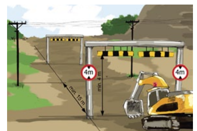
Rys. 2. Bramka ograniczająca wysokość przejazdu