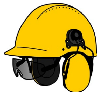
Rys. 2. Użytkowanie wielu środków ochrony indywidualnej jednocześnie