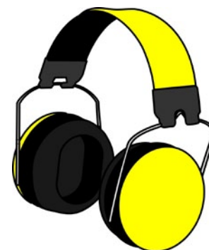
Rys. 8. Ochronniki słuchu