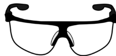
Rys. 7. Okulary ochronne