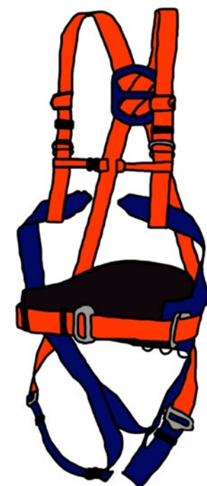
Rys. 10. Szelki bezpieczeństwa