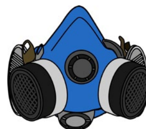
Rys. 9. Półmaska z pochłaniaczami