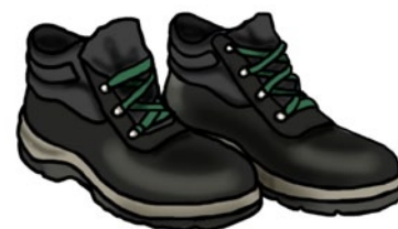
Rys. 4. Obuwie ochronne