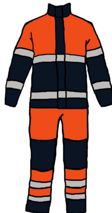
Rys. 3. Odzież ochronna