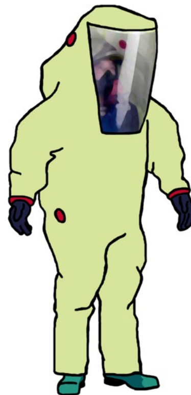
Rys. 11. Kombinezon izolacyjny