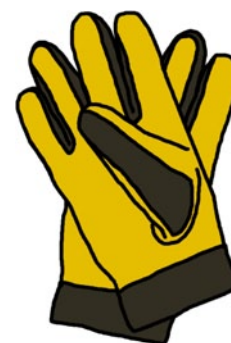
Rys. 5. Rękawice ochronne