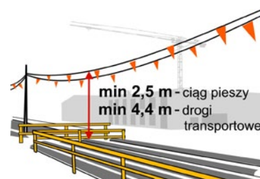
Rys. 1. Wysokość powieszenia przewodów ruchomych