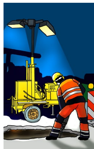
Rys. 6. Oświetlenie na statywach