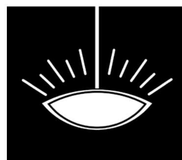
Rys. 2. Oprawa przy oświetleniu bezpośrednim