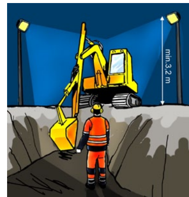
Rys. 5. Oświetlenie placu budowy