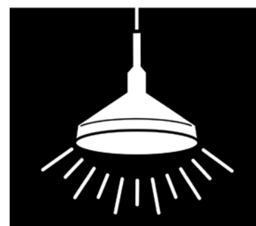
Rys.3. Oprawa przy oświetleniu pośrednim