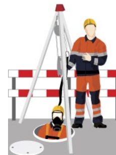
Rys. 4. Asekuracja pracowników przy pomocy trójnogów