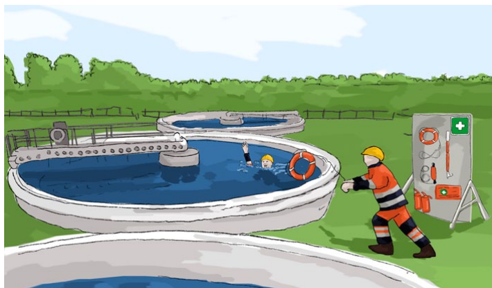
Rys. 1. Organizacja punktów pierwszej pomocy