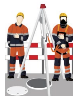
Rys. 3. Aparaty ratunkowe uciezkowe