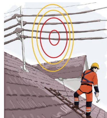
Rys. 1. Strefy prac pod napięciem i w pobliżu napięcia