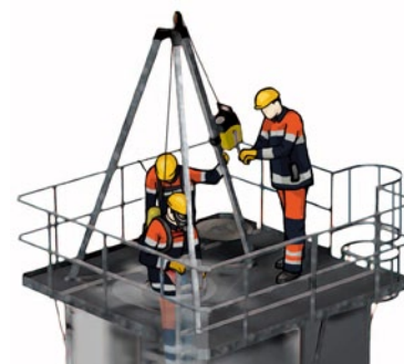
Rys. 2. Zastosowanie trójnogu ewakuacyjnego przy robotach w studzienkach kanalizacyjnych