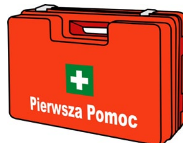
Rys. 4. Przenośny zestaw pierwszej pomocy