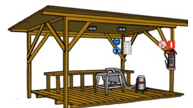
Rys. 1. Stanowisko pracy piły tarczowej stołowej