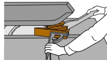
Rys. 2. Popychacze