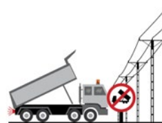
Rys. 5. Zakaz podnoszenia skrzyń ładunkowych w sąsiedztwie napowietrznych linii energetycznych