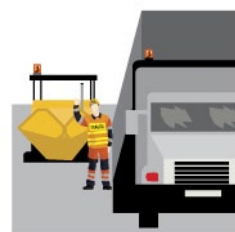
Rys. 4. Wyznaczenie osoby koordynującej przy manewrze cofania pojazdu