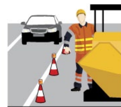
Rys. 3. Podstawowa ochrona indywidualna przy pracach bitumicznych