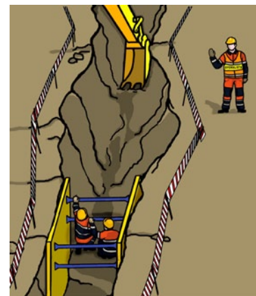
Rys. 4. Prace w wykopach wąskoprzestrzennych