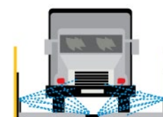
Rys. 3. Myjnia dla pojazdów budowy