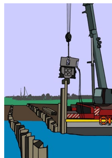
Rys. 5. Stabilizacja maszyny na podłożu podmokłym i bagnistym