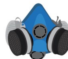
Rys. 2. Półmaska ochronna z pochłaniaczami